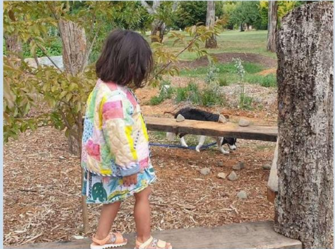
若い女の子がワトソン・マイクロフォレストの遊歩道を試しています。

宮脇の森と自然遊びの旅のために資金を要請することはできますが、助成金ではそれができない可能性があります。