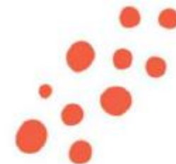
ワトソンマイクロフォレスト